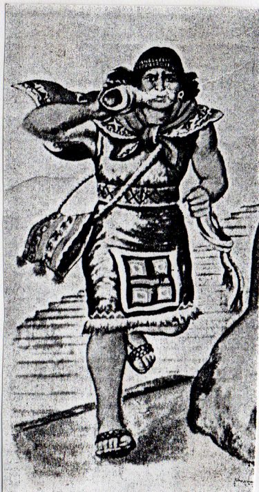
El chasqui huañino cubría la ruta entre los tambos Julca y Pariacaca.