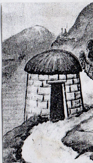
Tambo de chasquis similar a los de Julca y Pariacaca.